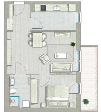
2 ZIMMER ca. 60 m 2