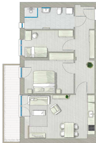
3 ZIMMER ca. 75 m 2