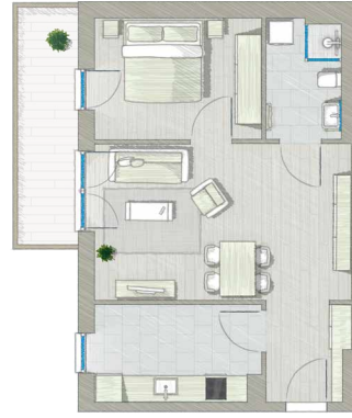
2 ZIMMER ca. 60 m 2