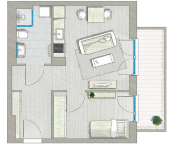
2 ZIMMER ca. 45 m 2